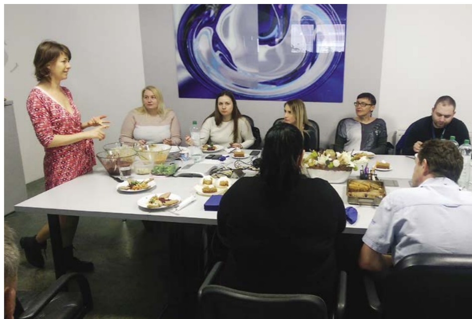
Prínosná a zároveň chutná prednáška

Takéto nápoje čakali hneď ráno na zamestnancov kovárne