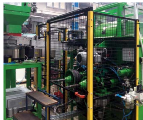
Stroj Gnutti je po generálnej oprave, robot ABB spoločne s vibračným zásobníkom je kompletne nový. Pochádza z Talianska.