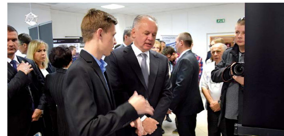
Prezident pri rozhovore so študentom SPŠ, ktorého podporila spoločnosť SLOVARM v 1. Ročníku slovenského kola medzinárodnej súťaže vodíkových áut Hydrogen Horizon Automotive Challenge

Deviatakom a ich rodičom začína pomaly ale určite robiť vrásky, akú strednú školu si vybrať, ktorým smerom sa vydať.